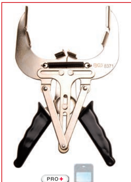
PINZA PER SEGMENTI PISTONE