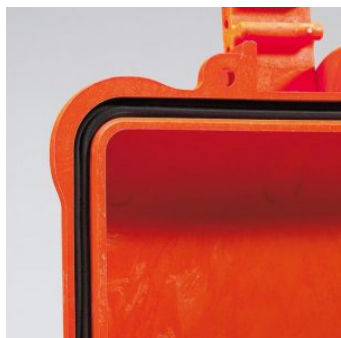
GUARNIZIONE A SIGILLO