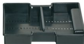
KIT TRAY MUB