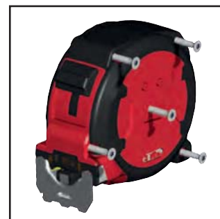
Cassa ABS - 5 viti