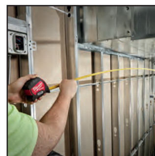
RIGIDITA' DEL NASTRO FINO A 4M