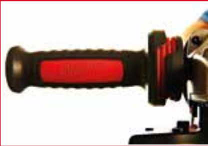
Impugnatura laterale anti-vibrazione AVS