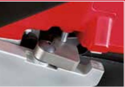
Profondità di taglio regolabile