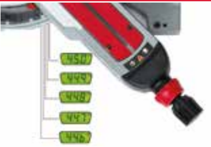
Regolazione accurata del taglio