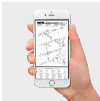
Elenchi dei pezzi di ricambio