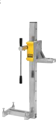
REMS Simplex 2