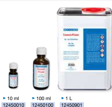
► 10 ml 12450010 ► 100 ml 12450100 ► 1 L 12450901