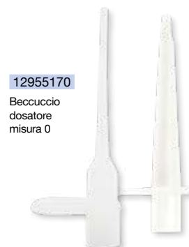
12955170 Beccuccio dosatore misura 0