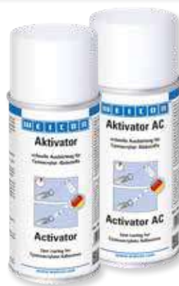
► 150 ml 12500150 Spray Attivatore Contact